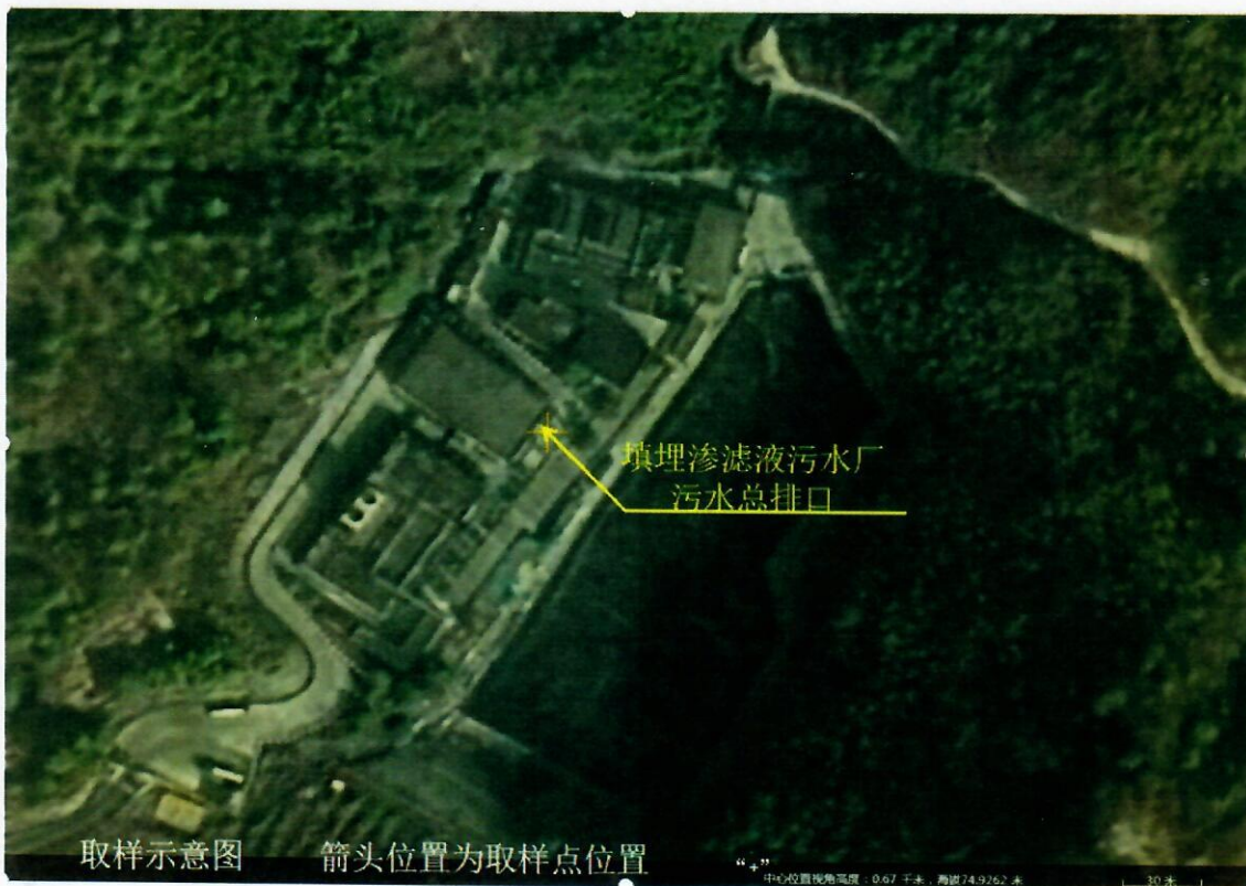
附件二: 现场采样照片